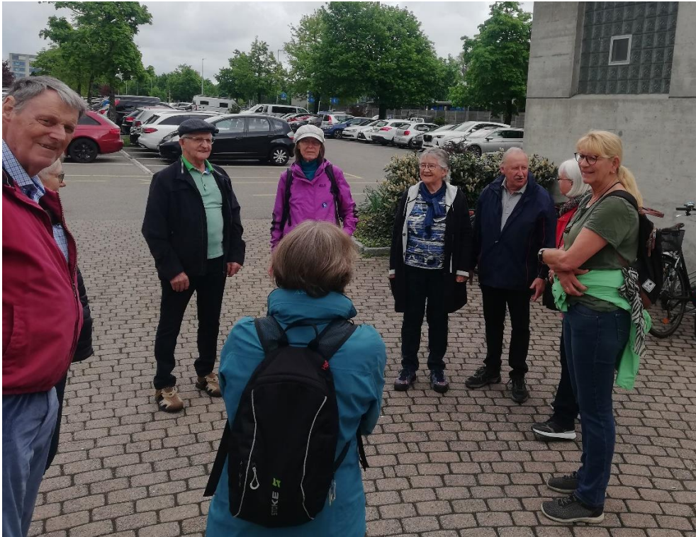
"Technische Daten" zum Spaziergang:

10 Vereinsmitglieder haben den gemütlichen Spaziergang genossen und anschliessend bei einem Umtrunk im Parkhotel die Geselligkeit gepflegt.